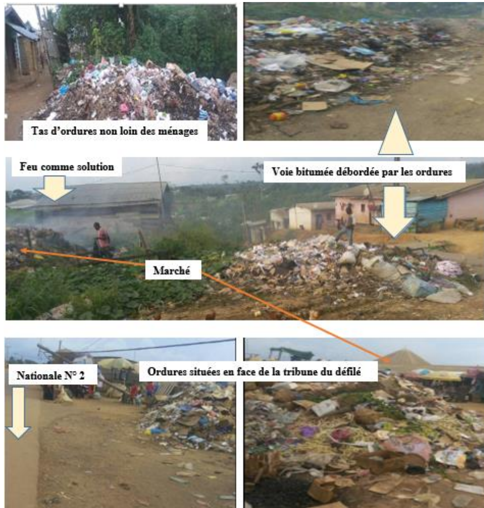
Figure 2.- Insalubrité à Kyé-Ossi : ménages et infrastructures routières au défi.

Subséquentement, les sociétés ne traitent l'environnement et les situations que selon les perceptions et les représentations qu'elles en ont. Ignorer ces saletés et ordures déjetées qui polluent déjà la vue et l'atmosphère prouve une représentation neutre, sans considération de la protection de la nature. Voilà où se situe le danger et le risque de l'environnement à Kyé-Ossi, suscitant les enjeux de durabilité de l'espace face à l'invasion des ordures. Même les cours d'eau ne sont pas épargnés.